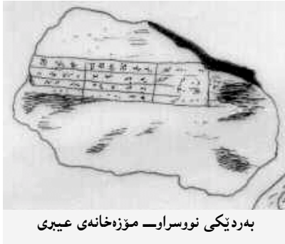
به‌ردی‌کی نووسراو- مۆزه‌خانه‌ی عیبری

ئهو باوه‌رپه‌ش هه‌یه که شولگی پاش له‌شکره‌شییه‌کانی دژی سیموروم نازناوی " پادشای چوار لاکانی جیهان " ی له‌خۆی نا، به‌لام له‌کاتی‌که‌دا (گوتزه) ئەمه ده‌گه‌رپنیته‌وه بۆ دوايه‌مین " وێرانکردنی " سیموروم له‌لایه‌ن شولگییه‌وه (هالۆ) له‌ دوا‌ی قۆناغی یه‌که‌می شه‌په‌ه‌کانی داناوه که ناوی ناوه " جه‌نگی خورری یه‌که‌م " و که له‌ ساڵی ٢٤ تا ٢٧ ی شولگی درێژه‌ی کیشا (٢٤ دژی کارخار، ٢٥ و ٢٦ دژی سیموروم، ٢٧ دژی خارش‌ی) و بۆچوونه‌که‌ی (گوتزه) په‌سه‌ند ناکات. ٢