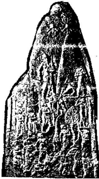
نارام سین لە (میلی سەرکەوتن) یدا مۆزەخانەى لوشر

ئەمە دیاردەیهکی دەگمەن نییە، بۆ نموونە چەند سەدەیهک دواى پادشایانی ئەکەد پادشای خانتی (حیثی) موریلی دووهم (ئەنادۆل - کۆتایی سەدەى (١٤) ی پیش زاین) باسی مردنی باوکی کردووە (کە پادشا بوو) بەهۆی کە ((بوو بەخوداوەند)) و ((چۆتە ریزی خوداوەندەکان)). ١ مردوو پەرستەن دیاردەیهکی بەرچاوی مرقایەتییه و گەرەترین ئەسلی نایینە شرکییهکانە.