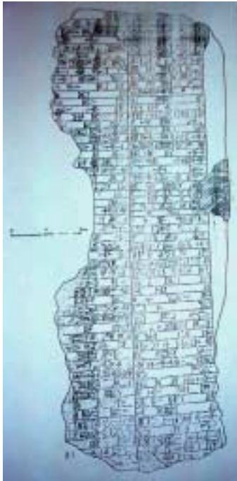
به رده که ی غه رب هه لده نی

شارو و لاټی زووری تێدایه تهنها ئاماژه بو ئهم چهند ناوه ده کهم که هه ندیکیان له ده که کانی شمشاره یان ده که هاوچه ر خه کانی ده بینین. یه که له وانه شاری شیکشابیوم (یان شیکشامبوم) که لیڤه دا به شیوه ی شیکشامبی هاتوه، هه روه ها و لاټی ئوتووا، که له ده که کانی شمشاره دا و لاټی (ئوتیم) باسکراوه و پیده چیټ ده شتی رانیه بووبیټ. هه روه ها و لاټی شاریداخوم که ناوی شوروتخوم له تو ماریکی سالیکی ئامار سیندا هاتوه و له گه ل شاشروم (شمشاره) "ویرانکرا بوون"، ئه مه ش جگه له وه ی له ده که کانی شمشاره دا