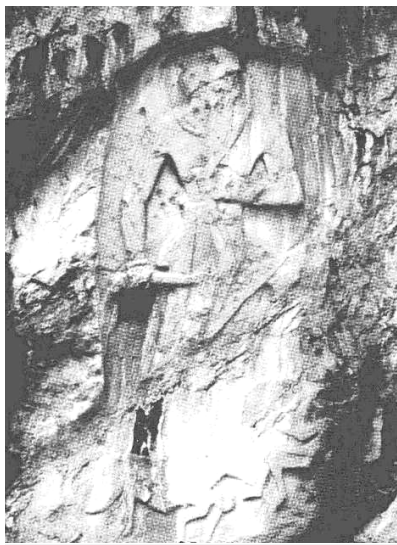
نەخشەکەى دەر بەندی گاور

بوو)، بەلام دواتر بیدعەیهکی گەرەتر هاتە ئاراوە ئەویش پادشایان ویستیان لەکاتی ژیاکاندا بێنە خوداوەندو پەرستین.