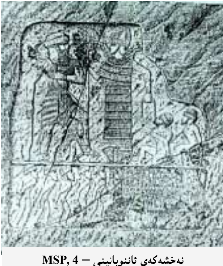
نەخشەکی ئانوبانینی - MSP, 4

رایهکی تر دهلیت ئەم پەفتاره پەییوەندی ههیه به سرووت (طقس) یک پینی دهوتریت زهواجی پیروز (الزواج المقدس) که تیایدا خوداوهندیکی ئافرت دهبیته ژنی پادشا. لیكدانهوهیهکی تریش نهوهی ئەم کاره ههولیک پادشایان بوو بو بهخشینی یهکیته به ولایتیک شتی زور دهبنه مایه پهرتهوازیی و ناوکۆکی تییدا. به پروای خویشان ههر کام لهه هویانه هویهکی لاههکییه لهچاو ئەو حهزه پادشا به مهزنیته. واته یهکه شت ئەو حهزه پادشایه، پاشان ههر هویهکی تر که ههبیته زیاده هاندهریکه. بیگومان سهردهمهکهو بارودۆخی ناو کۆمهلگه دهستنیسانی دهکات چهند بو پادشاکه دهلویت خۆی بکاته خوداوهند. ئەگه حالهتی کوردستانی کۆن وهبرگرن؛ به پال ههر یه که لهه هویانه هویهکی تر ههیه پەییوەندی به جیاوازی ناستی شارستانی نیوان ئەم و ولاتی دراوسیی. پهنگه فیرعهونهکانی کوردستان بهر لههه موو شتی و ههک لاساییکردنهوه ئم کارهیان کردبیت.