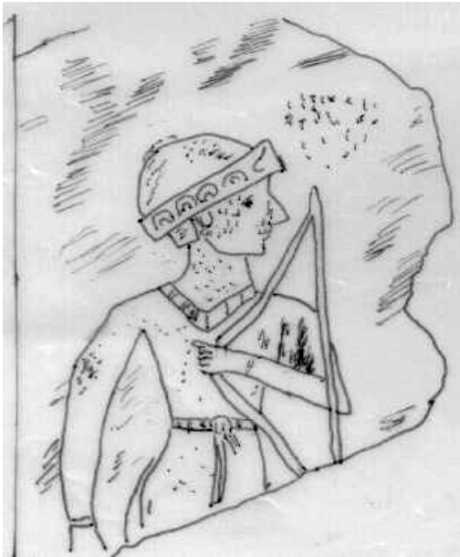
نەخشییکی بیتواته مۆزه‌خانه‌ی عیبری (به‌دهست له‌سه‌ر وێندەکه کردومانه)

له‌لایه‌کی تره‌وه شتیکی شایسته‌ی سه‌رنجه که ده‌قه دورودریژه‌که‌ی ئیدی سین، واته‌ ئه‌و ده‌قه‌ی به "به‌رده‌که‌ی غه‌ریب هه‌له‌دنی" ناسراوه، له‌ ژیر زه‌ویدا له‌ گوندی (قهره‌چه‌تان) له‌سه‌ر ریگای سلیمانی-سورداشدا دۆزرا‌بووه‌وه. پرسیاره‌که‌ش ئه‌وه‌یه: په‌یوه‌ندی ئه‌مه‌ به‌ شوینه‌که‌ی سیمورومه‌وه چیه؟ نایا سیموروم له‌ویوه نزیك بوو یان مه‌سه‌له‌که‌ ئه‌وه‌یه به‌رده‌که وهک یادگاری له‌ویدا دانرا‌بوو؟ ئه‌گه‌ر دووه‌میان بیته‌ ئه‌و کاته یان شاریکی گرنگ له‌ویدا هه‌بووه یان ناوچه‌که‌ خۆی گرنگ بووه ئه‌ویش به‌حوکمی هه‌بوونی کیوی پیره‌مه‌گرون له‌ویدا که دور نییه کیویکی پیروز بوویته‌ به‌تایبه‌تی ئه‌گه‌ر بزاین که کیوه‌که پاش زیاد له‌ هه‌زار سال، وردتیش سالی (٨٨١ پ.ن) له‌لایه‌ن پادشای ئاشوری، ئاشورناصیرپالی دووه‌مه‌وه، وا باسکراوه که ناوه‌که‌ی لای لولوییه‌کان کینیا Kinipa یه به‌لام خۆی ناوی ده‌نیته‌ نیصیر (پزگارپوون)، نیصیریش ئه‌و کیوه‌ی داستانی گلگامیش بوو که که‌شتیه‌که‌ی نووحی ولاتی دوورپوار له‌سه‌ریدا نیشتبوو.