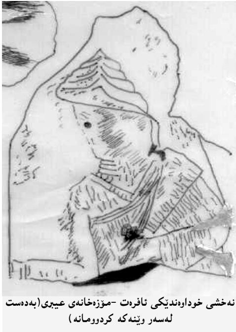
نەخشی خوداوەندیکی ئافرهت - مۆزەخانەی عیبری (بە دەست لە سەر و پێنە کە کردرومانە)

یه که مه کانی لیستی پادشاو و لاتە راپه‌ریوه‌کان ناوی پادشای شیمورروم هاتوو هه‌ویش پوتتیم ئادال Pu-ut-ti-im-ad-al که گیلب به پوتتیم - ئاتال ی داناهو به خوریری زانیوه ۱ .