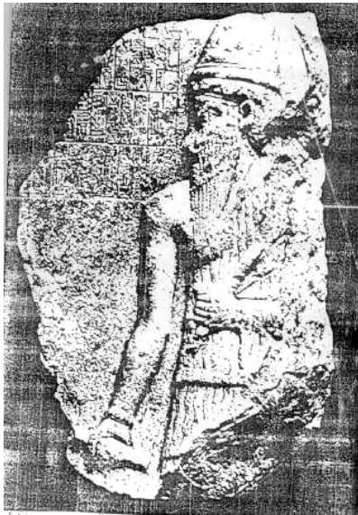
نەخشەکەى نارام سین - پیر حسین نزیک دیار بەکر - مۆزەخانەى ئەستەمبول

سەبارەت بە چۆنییەتی پەیدا بوونی ئەم کارە ڕەنگە شتیکی وەهامان نەبیست تەفسیریکی گونجاومان بداتن، بەلام لەوانە یە پادشا هەرە کۆنەکان بەر لە پادشایانی ئەکەد دواى مردنیان پلەى خوداوەندییەکان پێ بەخشیاریست.