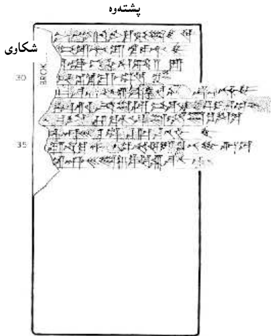
پشته‌وه‌ی نامه‌ی شماره ۸۸۸

ئه‌و کاته بوو شامشی ئاداد و ئیشمی داگان Išmē-Dagān ی کورپی نوینه‌ری خه‌باتیان ده‌کرد له‌پیناوی دامه‌زاندنی ده‌سه‌لاتی خۆیان به‌سه‌ر میرنشینه خوررییه تازه پیکه‌یشتوه‌کان له‌زنجیره کیوه‌کانی زاگرو‌سدا. ئه‌و کاته بوو که شاری وه‌کو ئارراپخا Arrapha و قابرا Qabrā و نوروگوم و Nurrugum و ئیستاش به‌پال ئه‌مانه‌وه شیکشابیوم Šikšabbum بو ده‌سه‌لات و بالاده‌ستی ناشوری تیشکیان خستبووه سه‌ر.