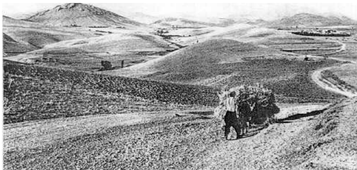
زببیا و زیویه له رۆژتاواوه

زببیا (بروانه ناوی مرۆقی کاششی وهك ئوزیبی Uzibi، ئوزیبیا Uzibya، ئوزیبو Uzibu، بروانه نمونهی جۆراوجۆریش له باره ی نهوهی كه ناوی مرۆقی کاششی ههروهه بۆ ناوی شوین به کار دین)، نازو (?). ... [ئینزی، یانزو. ی کاششی. دووهمیان له کاتی شهلمانه صهری سییه م و سارگۆنی دووه مدا هه بووه ]، نازینیری. ناویکی ئیرانییش كه جیگه ی رهخنه نییه برایهکی ئولوسونو هه لیگرتوه ئه ویش باگداتتی Bagdatti (باگداتتو = خودا داویه تی) 14 .