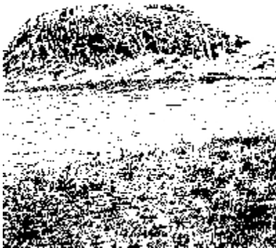
میشتا (= میسیسی ماننا) - تاش تپه ی ته مرۆ

تهنیا كه میکیان وهك ئیرانی دهردهكهون. كۆمهانی یهكه می ناوهكان پاشگری (كك) ی خوررییان ههیه. ئەمه لهم ناوانه دا ههیه: