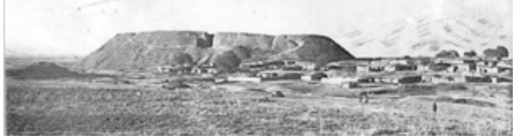
گردی به کراوا - سومر 17