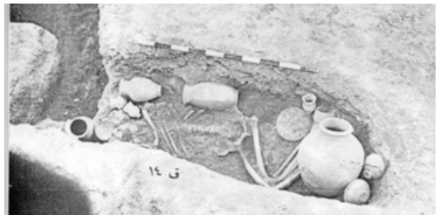
گۆرتهك له چینی 7 - سومر 17