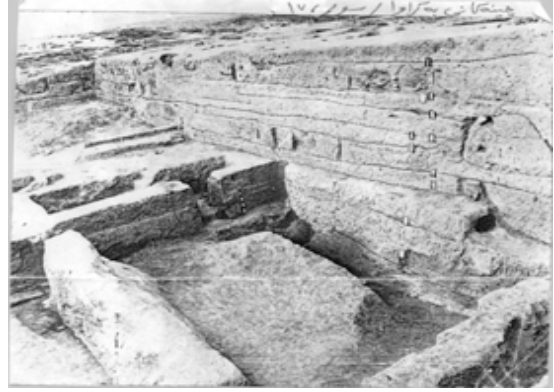
هه نديك له چينه كانی گردی به کراوا - سومر 17